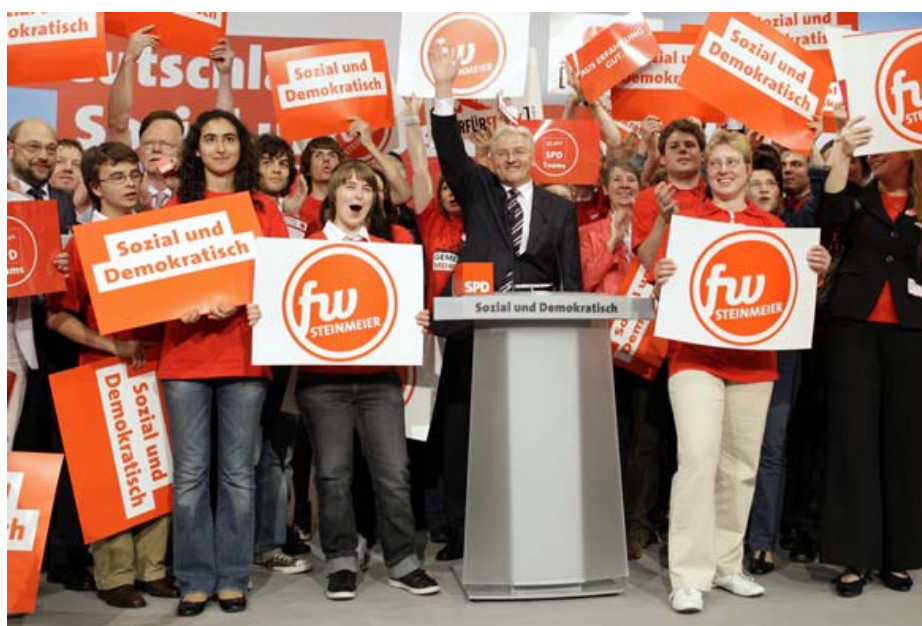
Es war sein Parteitag: Kanzlerkandidat Frank-Walter Steinmeier

Es gibt sicher viel zu sagen über unseren sozialdemokratischen Parteitag am vergangenen Sonntag. Es ist notwendig, dass wir uns mit der grundsätzlichen Ausrichtung unserer Politik für die Zukunft, mit unserer Programmatik und auch mit den Entscheidungsstrukturen sowie den personellen Strukturen in unserer Partei befassen. Auch die Ritualisierung von Parteitagen und Veranstaltungen sollte nicht ausgespart werden. Fest steht aber: Frank-Walter Steinmeier hat auf dem Parteitag in