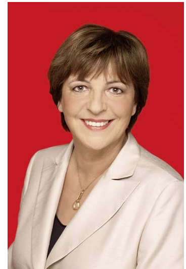
Ulla Schmidt beschert den Hospizen mehr Geld

Wir stellen jetzt sicher, dass die Hospize solide finanziert ihre Aufgabe wahrnehmen können. Die zuschussfähigen Kosten der stationären Hospize werden künftig für die Versicherten in vollem Umfang von den Kranken- und Pflegeversicherung übernommen und auch die ambulanten Hospize erhalten einen festen Zuschuss.